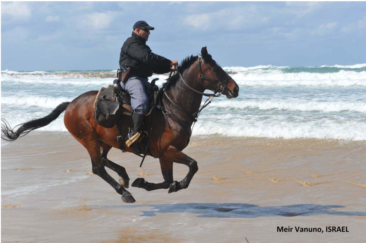
Meir Vanuno, ISRAEL